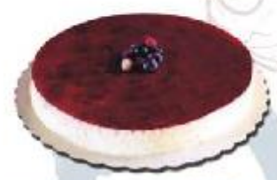
Queso y arándanos