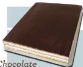
Chocolate y Nata