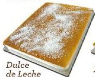
Dulce de Leche