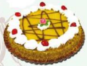
Charlota de turrón