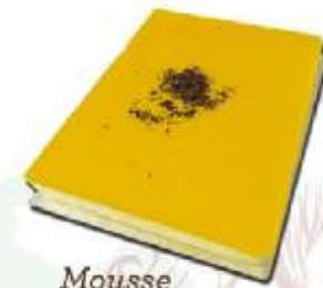
Mousse de Limón