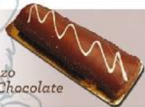
Braza de Chocolate