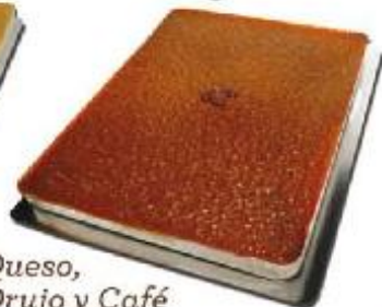
Queso, Orujo y Café