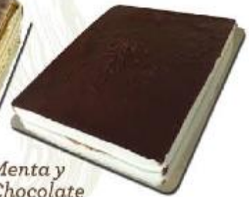
Menta y Chocolate