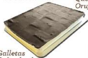
Galletas de la abuela