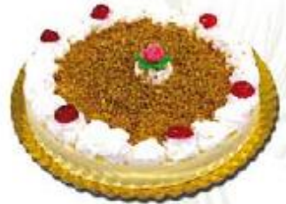
Charlota de nata