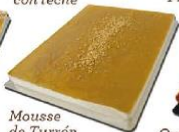
Mousse de Turrón