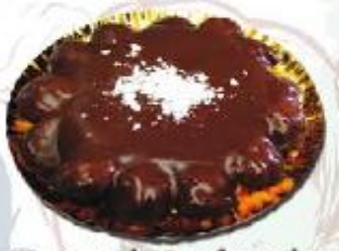
Myrian de Profiteroles