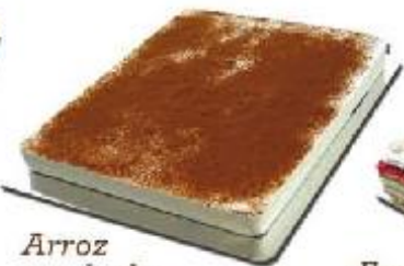
Arroz con leche