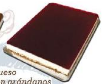
Queso con arándanos