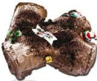
Tronco de Navidad